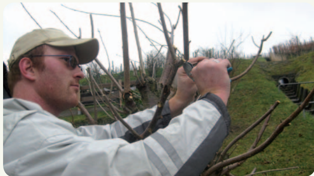
Ausgelagerter Arbeitsplatz Garten- und Landschaftsbau

Gerne beraten wir Sie über die unterschiedlichen Angebote zur Teilhabe am Arbeitsleben.