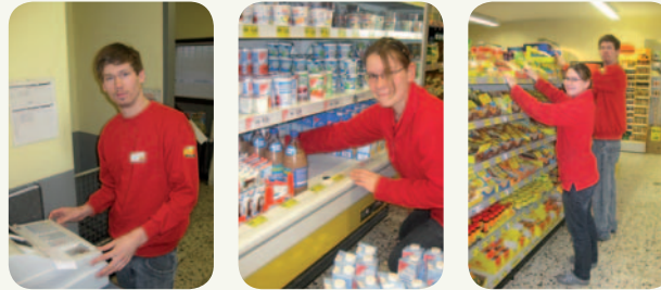
Ausgelagerter Arbeitsplatz Lebensmittelmarkt