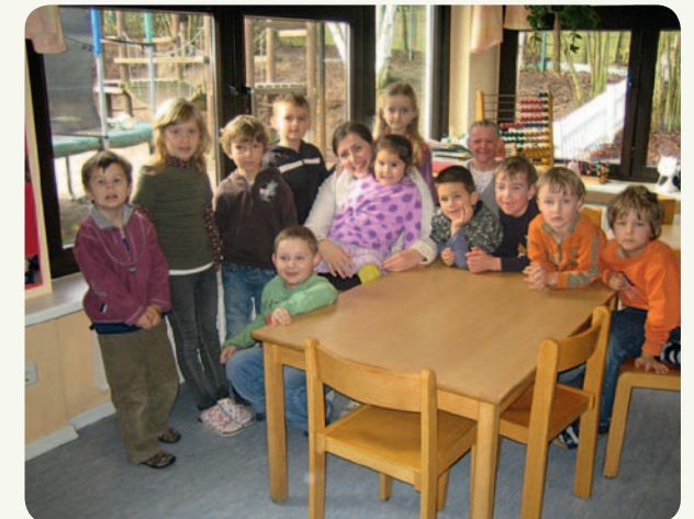
Ausgelagerter Arbeitsplatz Kindertagesstätte